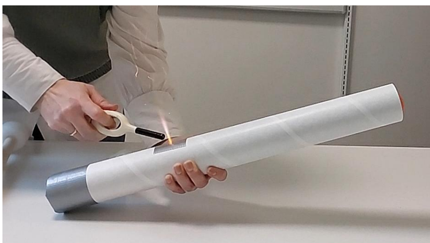
Figur 1: Den færdigbyggede gaskanon er netop blevet tændt. Stikflammen fra forbrændingen inde i røret er synlig.

Du skal bygge en gaskanon, som vist i figur 1, hvor du afbrænder lightergas og undersøger, om reaktionen går hurtigt eller langsomt. Desuden skal du undersøge, om der faktisk kommer energi ud af afbrændingen.